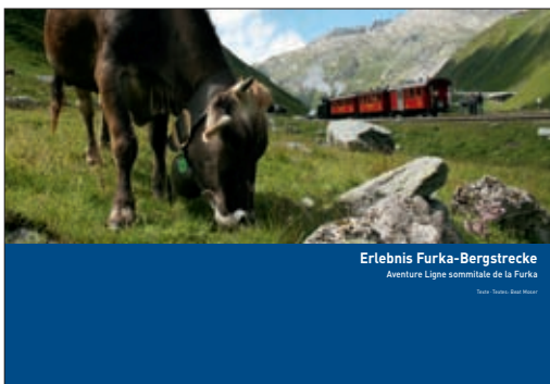
Erlebnis Furka-Bergstrecke Aventure Ligne sommitale de la Furka