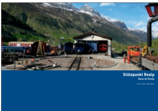
Stützpunkt Realp Base de Realp